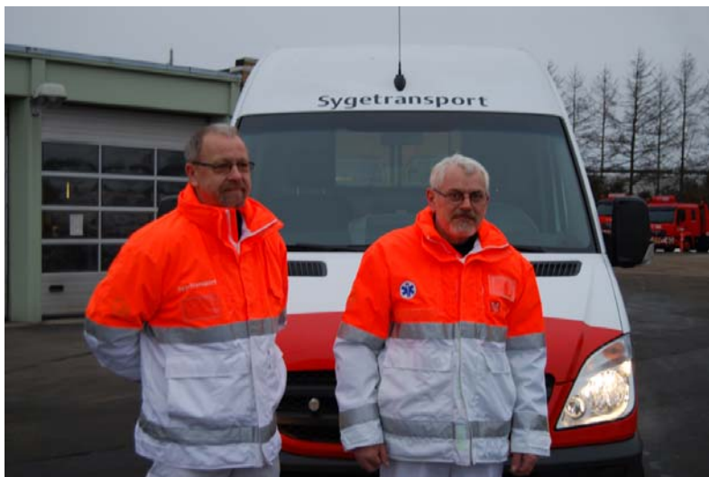
Sygetransport klar til afgang fra Falck-stationen på Svendborgvej i Odense.