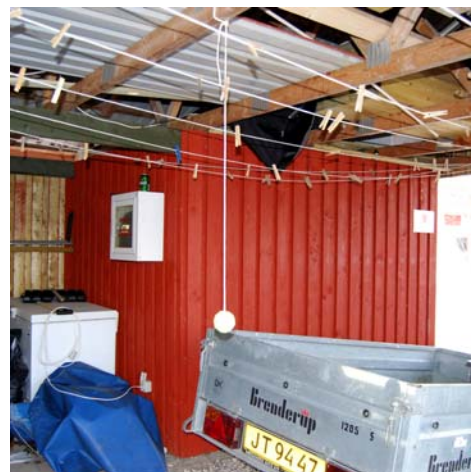
Hjertestartere på Langeland er opsat mange forskellige steder, her i en privat carport i Spodsbjerg